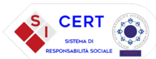
SA 8000 Social Responsibility